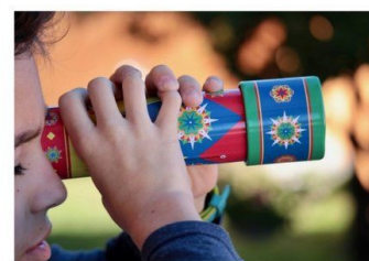
Ferienbetreuungen für Mainzer Kinder Veranstaltungskalender 2024